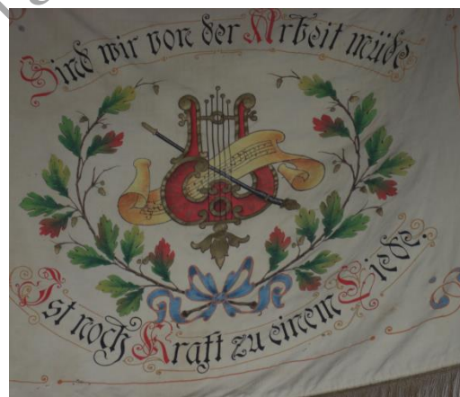
Rückansicht der Vereinsfahne

Was ist ein Verein ohne Dirigent. Hier konnten sich die Breitenbacher Sänger immer auf ihre Lehrer verlassen zumindest bis 1928. Folgende Dirigenten waren für Breitenbach aktiv: