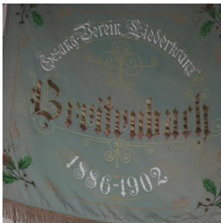
Vorderansicht der Vereinsfahne

Festzuhalten bleiben aber das Jahr 1902 in dem das 60-jährige Bestehen des Vereins mit einem Sängerefest gefeiert wurde und dass im Jahr 1902 der Gesangverein eine Vereinsfahne erhielt, die auch heute noch im Besitz des Gesangvereines ist. Im Jahr 1902 gab es in Breitenbach 33 aktive Sänger.